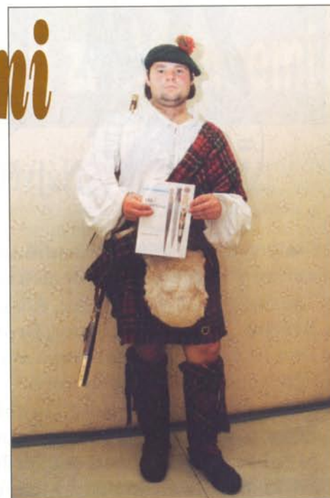
Člen klubu Trapper v skotském úboru z amerických koloniálních válek