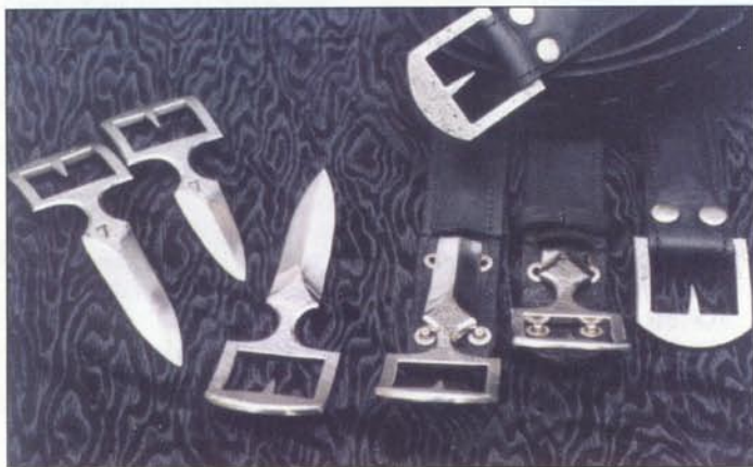
Firma Lasky dodává ke svým sponovým nožům též příslušné opasky