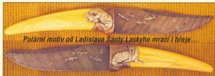
Polární motiv od Ladislava Šanty Laskyho mrazí i hřeje...