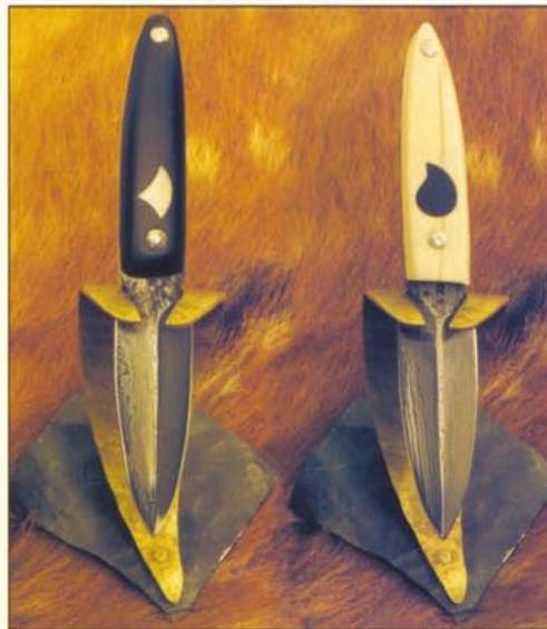
Jin a Jang Michala Roseckého. Damascénská čepel nože má dvakrát tordované jádro, střenky jsou vyrobeny z mrožího klu, ebenu a stříbra; do nýtů jsou vsazeny safíry