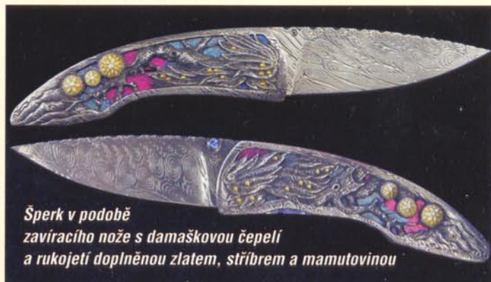
Šperk v podobě zavíracího nože s damaškovou čepelí a rukojetí doplněnou zlatem, stříbrem a mamutovinou