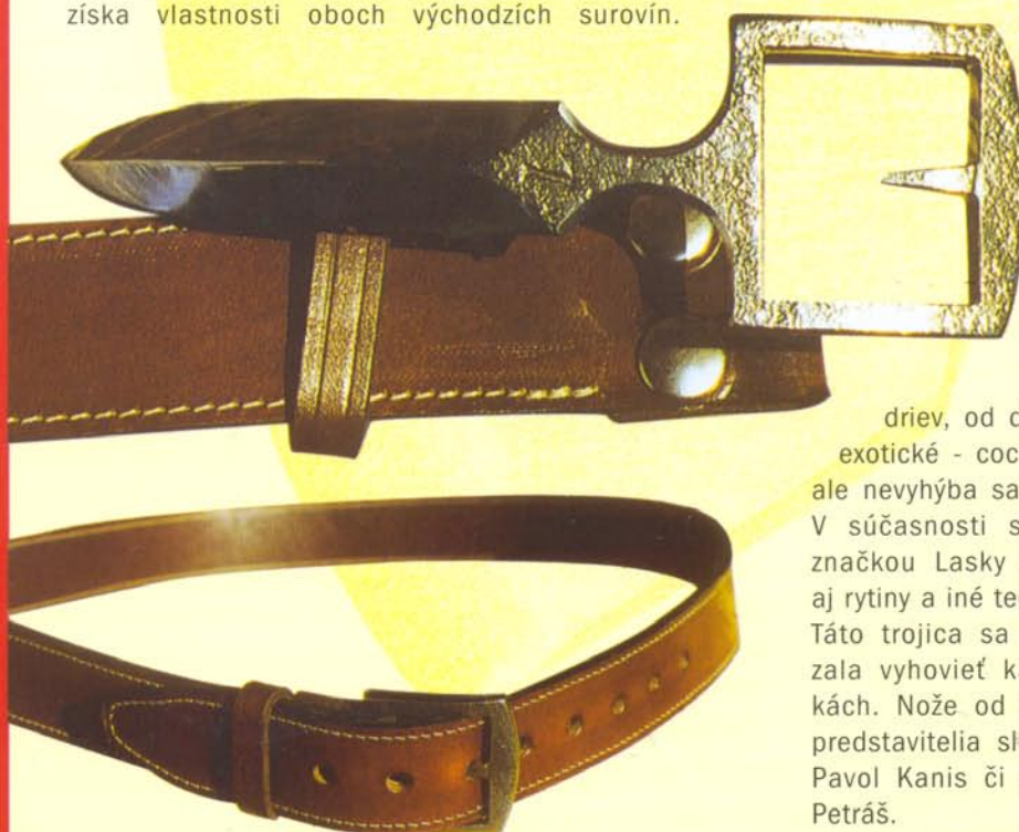
JEDEN Z NAJPOPULÁRNEJŠÍCH MAJSTROVÝCH VÝROBKOV. AKO JE VIDIET NA OBRÁZKU, NÔŽ SLUŽÍ AKO PRÁČKA OPASKU A ZÁROVEŇ SA DÁ POUŽIŤ V PRÍPÁDE NUTNEJ OBRANY. NA POŽIADANIE MÔŽE BYŤ Z UHLÍKOVEJ ALEBO NEREZOVEJ OCELE.

Všetky nože od Laskyho sú ručne kuté, čo im dáva zvýšenú pevnosť zhotútením materiálu. Na to používa