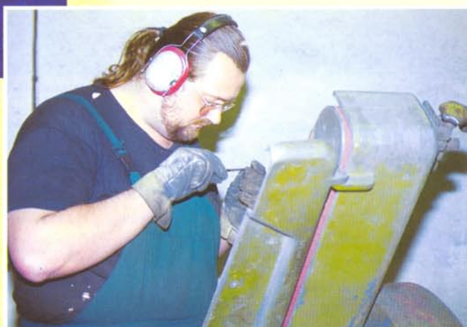
MAJSTER PRI PRÁCI SO SVOJOU PÁSOVOU BRÚSKOU.

Lasky vytvára v damašku najrozličnejšie vzory. Jedným z najzaujímavejších je nôž s čepeľou,