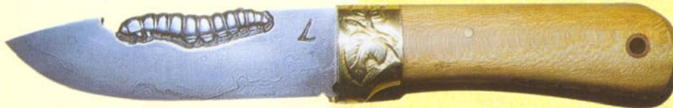
LOVECKÝ NŮŽ S DAMAŠKOVOU ČEPELOU S PLASTIKOU HÚSENICE NA CHRBTĚ ČEPELE. BOHATO RYTÉ KOVANIE JE Z MOSADZE, RÚČKA Z PLATANU.

Vysoká kvalita a krása ručne vyrobených nožov so značkou „Lasky“ bola ocenená na viacerých výstavách: