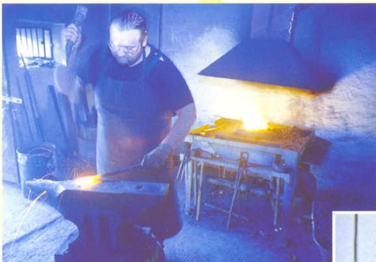
MAJSTER PRI PRÁCI VO VYHNI.

Tento materiál vymysleli starí majstri v Indii v časoch, keď metalurgia ešte nevedela vyrobiť materiál, ktorý by bol dostatočne tvrdý, aby nôž držal ostrie a zároveň pevný, aby sa nezlomil. Tak skuli pláty mäkkej a tvrdej ocele. Túto „sendvičovú“ oceľ potom rozpílii, znova poskladali a prekuli. Tento proces sa opakuje niekoľkokrát, až vzniká materiál podobný lístkovému cestu, kde sa striedajú pevne spojené tenúcké vrstvy (200 - 1500 vrstiev), mäkkej a tvrdej ocele. Výsledný materiál tak získava vlastnosti oboch východných surovín.